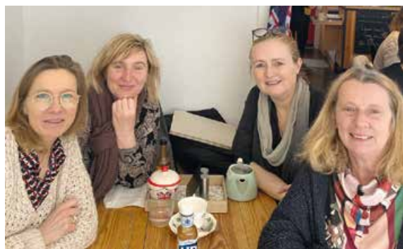
Les quatre porte-paroles du pôle 59G20 proposent aux usagers de se rencontrer chaque semaine, en ville, autour d'une boisson chaude.

L'initiative est née en 2015 dans le secteur 59G21 Lille-Est de l'EPSM Lille-Métropole qui a décidé de pousser plus loin l'idée de démocratie sanitaire, les liens et la concertation avec les usagers.