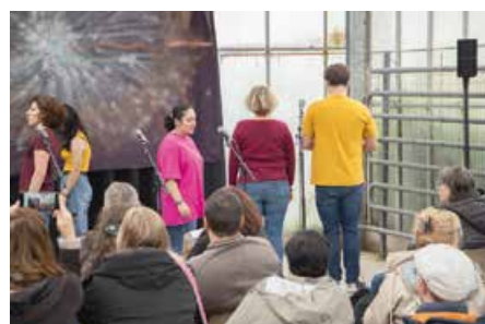
Prestation live le 27 septembre lors de la journée JEU m'amuse à l'EPSM Lille-Métropole.