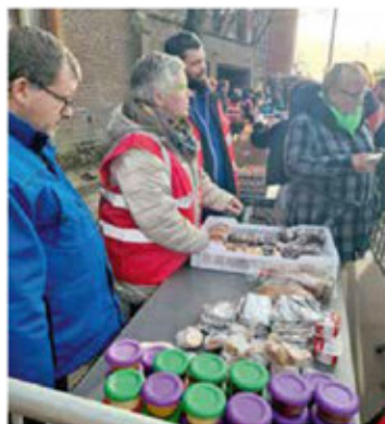
Les professionnels de santé aident les usagers lors des distributions.

La maraude dunkerquoise initiée par l'Association des Amis de Jacques Bialski accueille des professionnels de santé et des usagers de l'Hôpital de Jour Ivalo. Ce projet lancé en avril 2023 mobilise des patients afin qu'ils distribuent des desserts aux plus démunis.