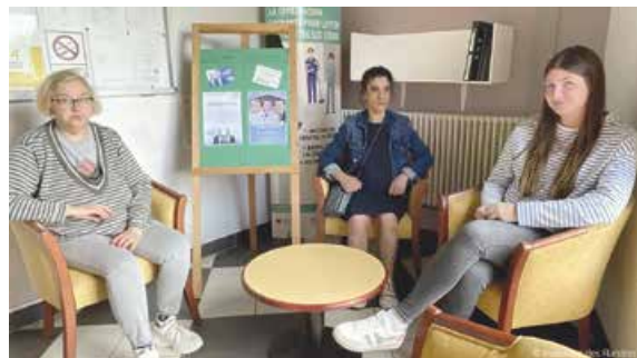
En avril 2022 et juillet 2024, les résidents votants avaient été interviewés par la Voix du Nord et l'Indicateur des Flandres afin de mettre en lumière le vote des adultes en situation de handicap.

Les résidentes ou résidents qui souhaitent s'exprimer vont voter accompagnés par du personnel soignant. Lors des dernières élections législatives en juillet 2024, ils étaient cinq résidents du Foyer d'Accueil Médicalisé (FAM) à se déplacer au bureau de vote. Après le vote, un temps est pris le lundi matin pour échanger sur des résultats électoraux.