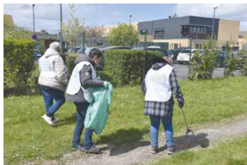
Les usagers répondent présents et sont pleinement engagés dans cette démarche écocitoyenne.

Le lancement de cet atelier a débuté en septembre 2021 sur le Centre de soins Jean-Baptiste Pussin de Cappelle-la-Grande. En effet, les usagers des unités Aurore et de l'Hôpital de Jour Ivalo se mobilisent jusqu'à deux fois par mois entre avril et septembre pour ramasser les déchets en ville. La cible, les communes de la Communauté Urbaine de Dunkerque.