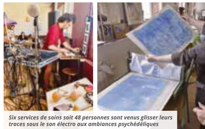
Six services de soins soit 48 personnes sont venus glisser leurs traces sous le son électro aux ambiances psychédélices