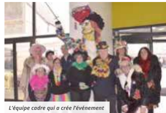
L'équipe cadre qui a créé l'événement