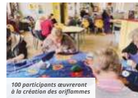
100 participants œuvreront à la création des oriflammes