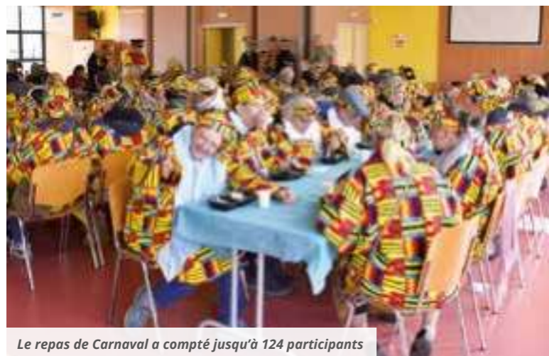
Le repas de Carnaval a compté jusqu'à 124 participants

Hormis ces nouvelles décorations, la société philanthropique de Bailleul a accepté d'intégrer un petit train dans le défilé à la demande de l'EPSM des Flandres. Toutes et tous ont pu ainsi participer à la fête. Le Mardi Gras a même vu l'intégration de résidents de l'hôpital général de Bailleul au groupe de l'EPSM et le repas de Carnaval a compté jusqu'à 124 participants.