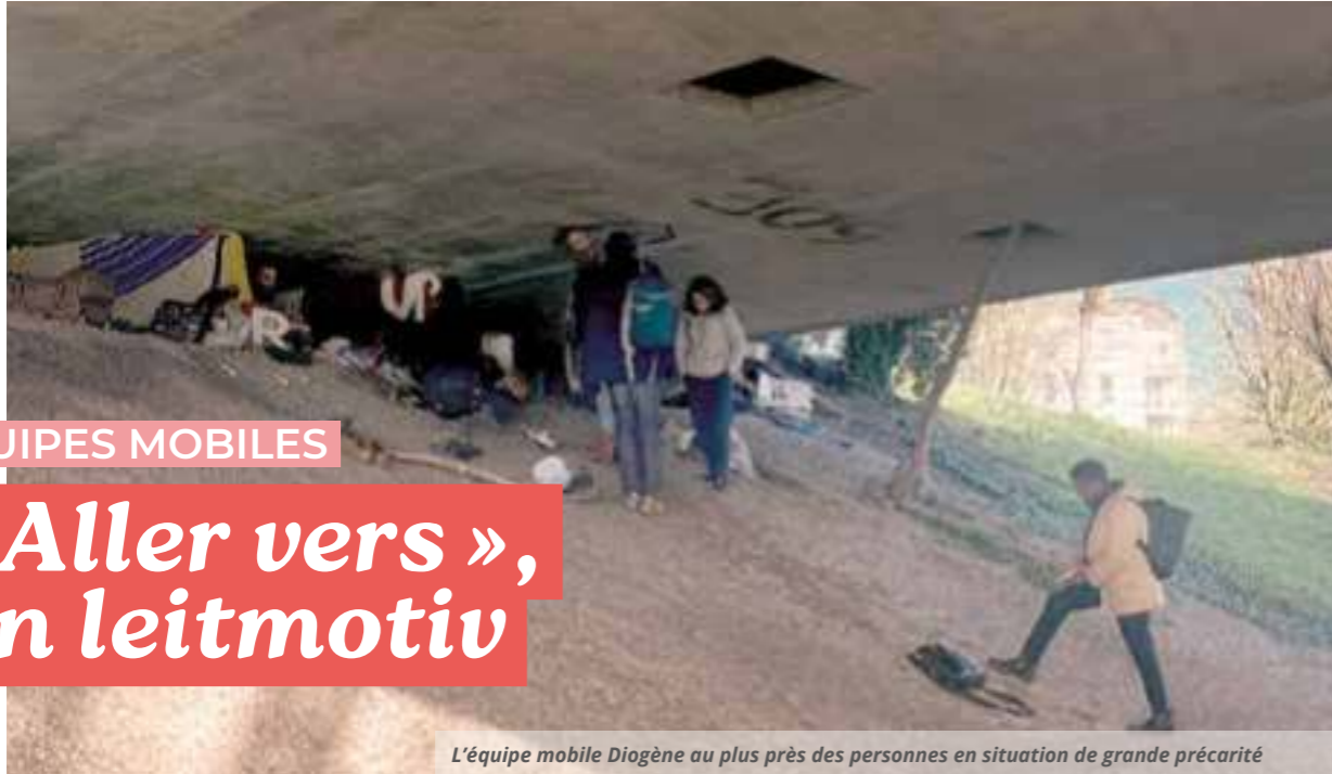
L'équipe mobile Diogène au plus près des personnes en situation de grande précarité