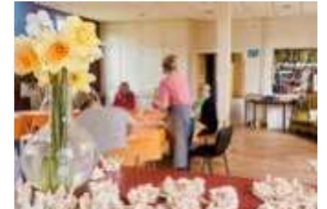
Les créations seront exposées durant le festival

Ce projet est d'imaginer à quoi ressemblerait la surface terrestre sans vie organique et bien avant l'impact des activités humaines. Ces exopaysages seraient-ils à l'image des exoplanètes ? L'occasion pour les usagers de découvrir à effleurer et à manipuler ces étranges reliefs. Du 19 au 23 avril dernier, ce sont plus de 50 patients et des élèves de l'École Municipale d'Arts Plastiques de Bailleul qui ont pu créer et laisser leur imagination se fixer dans l'argile.