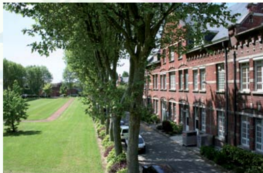
Un site à découvrir ou à redécouvrir

Les 21 et 22 septembre prochains, l'EPSM Lille-Métropole participe aux Journées européennes du patrimoine sur le thème « Arts et Divertissements ». Expositions, ateliers et contes au programme de cette 36 e édition.