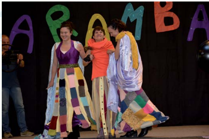
Podium de la salle de réception des Prés du Hem bondée pour l'occasion

Dans le cadre de Lille 3000 Eldorado, la Résidence Berthe Morisot participait le 24 mai dernier au temps fort « CARAMBA ! » : défilé de mode et exposition des travaux d'Arts Plastiques au couleur du Mexique.