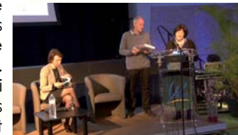
27 mars 2018 à Armentières

du Patient « vise à aider les patients à acquérir ou maintenir les compétences dont ils ont besoin pour gérer au mieux leur vie avec une maladie chronique ». Elle fait partie intégrante et de façon permanente de la prise en charge du patient. C'est un processus centré sur le patient, continu, planifié, régulier et intégré à la démarche de soins. C'est une démarche construite avec et pour le patient (décisions co-construites). Force est de constater que les patients/usagers qui en ont fait l'expérience, en retirent des bénéfices incontestables sur leur qualité de vie. Il a été souligné la nécessité de poursuivre ces programmes et qu'ils fassent l'objet d'évaluations afin de répondre aux besoins des patients et de leurs aidants. Des usagers ont éclairé la réflexion de leurs témoignages. Le modèle du rétablissement ainsi que les enjeux incontournables de la prise en compte de l'aspect motivationnel dans cette pratique