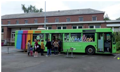
à Armentières, ateliers au Caféméléon, bus nomade, culturel et éco-citoyen

4 e semaine européenne du développement durable dans les EPSM Lille-Métropole, des Flandres et Val-de-Lys Artois