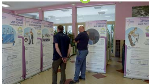
et exposition sur les gestes simple du quotidien

Pour la 1 re année, une douzaine d'actions se sont déroulées au sein des 3 EPSM du 30 mai au 5 juin 2018. L'accent a été mis sur les énergies collaboratives, les partenariats territoriaux, le travail collectif, illustré par les achats groupés (marchés alimentaires ou prestations de services, énergies, ...), les initiatives multiples et/ou mutualisées (ambassadeurs développement durable, covoiturage, plan de déplacement d'établissements,...). Au plan national, le site du ministère de la transition écologique et solidaire enregistre plus de 1500 projets. Une belle mobilisation collective !