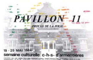
Semaine culturelle - Alain Buyse Intervention Gérard Duchêne

Alain Buyse, dans son atelier de la rue des vieux-murs, a accueilli chaque semaine pendant un an avec beaucoup d'attention et d'écoute, une