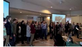
29 et 30 mars 2018 à Hellemmes-Lille

relations de pouvoir entre les individus, les groupes, les services et les gouvernements» 2 . Une centaine de présentations aura permis de faire avancer la réflexion et le partage des pratiques en matière d'empowerment et de citoyenneté en santé mentale. Retrouvez le programme et la synthèse sur www.ccomssantementalelillefrance.org/ Retrouvez les reportages WebTV sur www.epsm-lm.fr