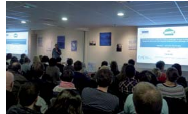
Restitution des résultats, à Lille le 09/02/2017

Le programme est généralisé en 2017 pour les 4 sites pilotes et sera déployé sur 16 nouveaux sites entre 2018 et 2022. Objectif, 2000 places qui s'intégreront